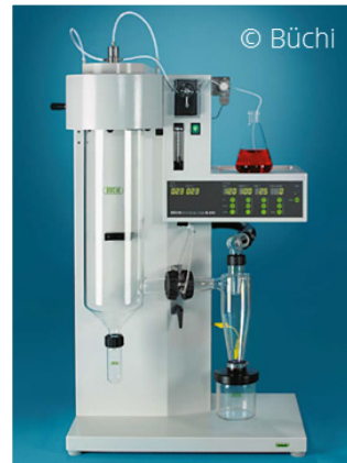
Mini-Sprüh Trocknung für Beschichtungsversuche im Labormaßstab.