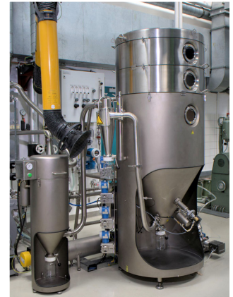
Beschichtungsverfahren im Technikumsmaßstab.